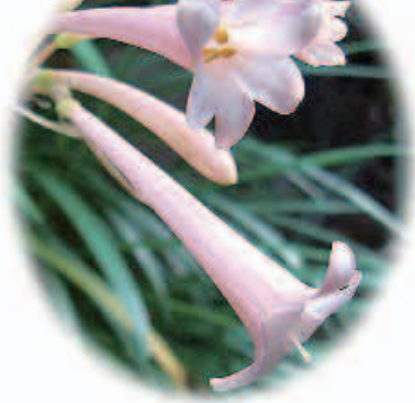
キルタンサス(きるたんさす) 花言葉…屈折した魅力

Cyrtanthus(キルタンサス)は、ギリシャ語で「曲がった花」のこと。そういえば、なんとなく花が湾曲している。南アフリカ原産。ラッパ状でうすピンク色。「キルタンツス」とも呼ばれる。