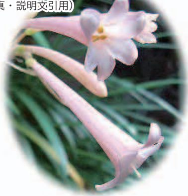
キルタンサス(きるたんさす) 花言葉…屈折した魅力

Cyrtanthus(キルタンサス)は、ギリシャ語で「曲がった花」のこと。そういえば、なんとなく花が湾曲している。南アフリカ原産。ラッパ状でうすピンク色。「キルタンツス」とも呼ばれる。