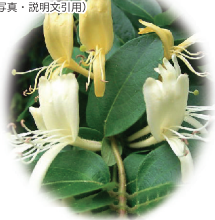
吸葛(すいかずら) 花言葉…愛の絆・友愛など

「水を吸う葛」の意から「吸葛」となった。また、昔は、花の奥の方にある蜜(みつ)を子どもが吸って遊んだことから「吸葛」となった、との説もある。花の色は、白から黄に変化していく。このことから中国では「金銀花」と呼ばれる。「忍冬」とも書く。また、「忍冬」の字のごとく、「にんどう」と呼ばれることもある。