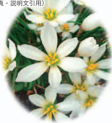
玉簾(たますだれ) 花言葉…汚れなき愛

開花時期は、8月5日～10月10日頃。白く美しい花を「玉」に、葉が集まっているようすを「簾」にたとえた。「南京玉簾」6弁花、上向きに咲く。葉は細長い。ずらーっと並んで咲いていると壮観。黒い実になる。実の形は狐の剃刀に似ている。「珠簾」とも書く。別名「レインリリー」雨のあとで一斉に咲きはじめるところから。