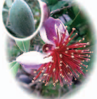
フェイジョア 花言葉…実りある人生

昭和初期にアメリカから渡来。赤い「はげ」のようなきれいな花。白いクッションのような綿毛に包まれている。実は緑色になる。すごく固い。食べられるらしく、ジャムなどに使われる。