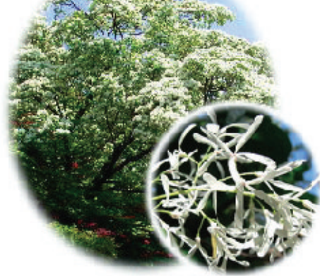
なんじゃもんじゃの木 花言葉…清廉

プロペラ型の白い花。すぐ散ってしまう。明治時代、東京の青山練兵場(今の明治神宮外苑)の道路沿いにこのなんじゃもんじゃがあり、名前がわからなかったので「何の木じゃ?」とか呼ばれているうちにいつのまにか「なんじゃもんじゃ?」という変わった名前になってしまった。