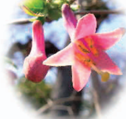
鶯神楽(うぐいすかぐら) 花言葉…未来をみつめる

鶯が鳴きはじめる頃に花が咲く、とのことからこの名前になったらしい(諸説あり)。また、「かずら」ではなく「かぐら」です。淡いピンク色のきれいな花。「うぐいす色」のイメージだと「緑色」だがこの花はピンク。初夏に赤いグミのような実がなり食べられる。