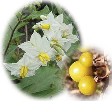
悪茄子 (わるなすび) 花言葉…欺瞞、悪戯など

北アメリカ地方原産。ナスに似た白い花。5弁花。茎と葉にとげがあり、繁殖力があり強いので“悪”と名づけられた。秋から冬にかけて、黄色い実ができる。けっこうきれい。だが夏場に、草刈りされてしまうことが多いので実を見かける機会はほとんど無い。実は有毒です。注意。別名「鬼茄子」(おになすび)。